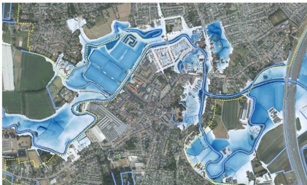
Figuur 1-1: Overstromingen in de huidige situatie in St. Oedenrode bij afvoergolf T100 WH+, de grens van de bebouwde kom is met een gele lijn weergegeven.

Waterschap De Dommel heeft de maatgevende hoogwaterstanden bepaald op basis van de laatste klimaatscenario's van het KNMI (figuur 1.1). Uit deze gegevens blijkt dat er maatregelen nodig zijn in een groot deel van de kern Sint-Oedenrode langs de Dommel. Het waterschap heeft de verplichting om deze maatregelen vóór 2023 uit te voeren.