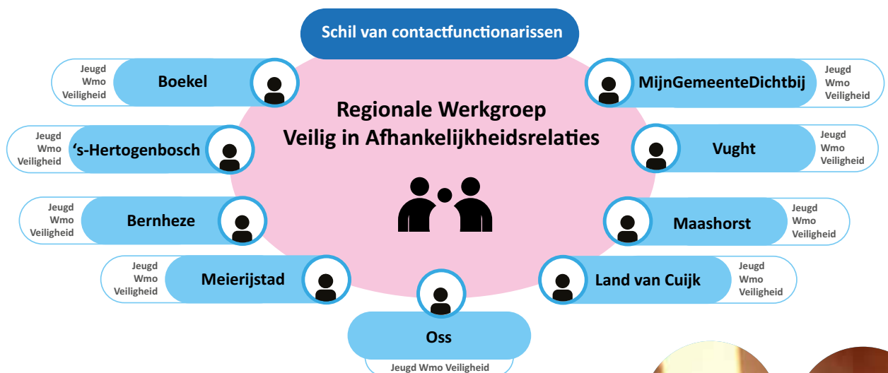
Afbeelding 3: Werkgroep en contactpersonen in schema.

De contactfunctionarissen hebben verschillende taken met bijkomende verantwoordelijkheden. Zij spreken met de werkgroep namens de drie domeinen Jeugd, Wmo en Veiligheid. De contactfunctionaris is de linking-pin tussen de eigen gemeente en de werkgroep. De werkgroep adviseert de contactfunctionarissen over implementatie van onderwerpen uit het uitvoeringsplan. De gemeenten zijn zelf verantwoordelijk voor de daadwerkelijke implementatie hiervan.