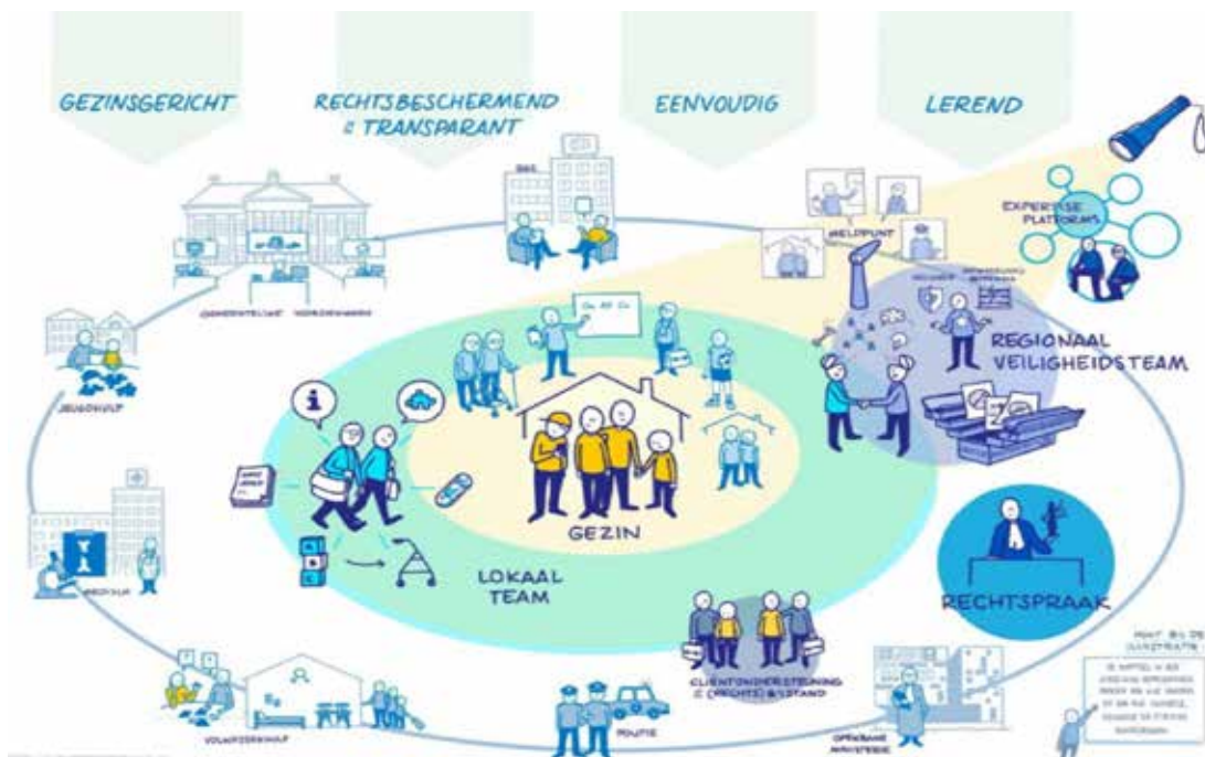
Afbeelding 1: Toekomstscenario kind- en gezinsbescherming